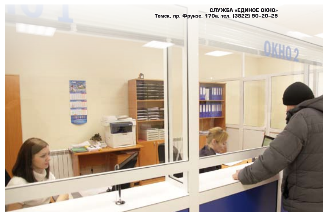
СЛУЖБА «ЕДИНОЕ ОКНО» Томск, пр. Фрунзе, 170а, тел. (3822) 90-20-25

В Кемеровской области у компании пять объектов, в Иркутской – пока один, в Горном Алтае – четыре объекта (один из газопроводов, который мы ведём, дошёл уже до посёлка Манжерок).